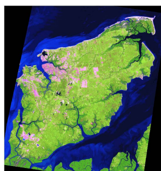
Figura 2 – Composição 543

Além das imagens de satélite, foram utilizados como base de dados cartas topográficas MI 495 e 594 (DSG, 1980), mapas hidrográfico, geológico, geomorfológico, pedológico, de uso e cobertura (Maranhão, 2002) e gerou-se, para o ano de 1984, um mapa de uso e cobertura vegetal, entendendo-se que este tema possui maior dinâmica na paisagem da região. Estes dados foram carregados e analisados em um SIG, permitindo a integração das informações.