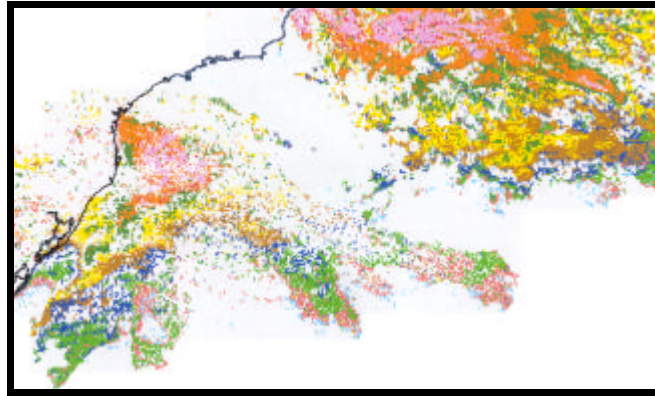
Figura 1: Imagem de TSM máxima do dia 12 de novembro de 2002.