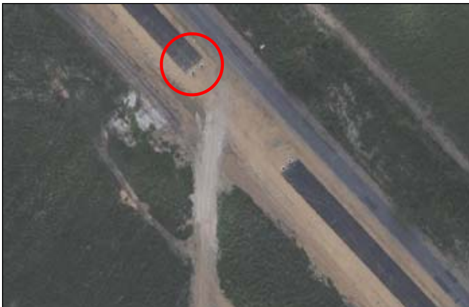
Figura 7. Sobrevôo destacando concreto compactado.

fotografias o detalhamento foi muito maior, porém a estabilidade do avião foi comprometida, não permitindo a geração de mosaicos para esse trecho. A Figura 7 mostra uma das fotografias adquiridas neste voo na qual é possível observar detalhes da obra como o concreto compactado a rolo.