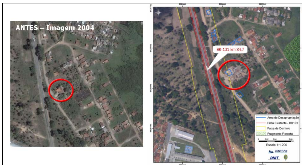
Figura 6. Montagem identificando uma área de desapropriação.

A metodologia avaliada permitiu identificar e monitorar (por meio de fotos anteriores) o cronograma de obras no trecho e espacializar processos correntes de desapropriação. A Figura 6 mostra um exemplo de desapropriação antes e após o início das obras e cobertura fotográfica da região. É possível identificar a remoção do imóvel visível na fotografia obtida com o sobrevôo no início de 2008.