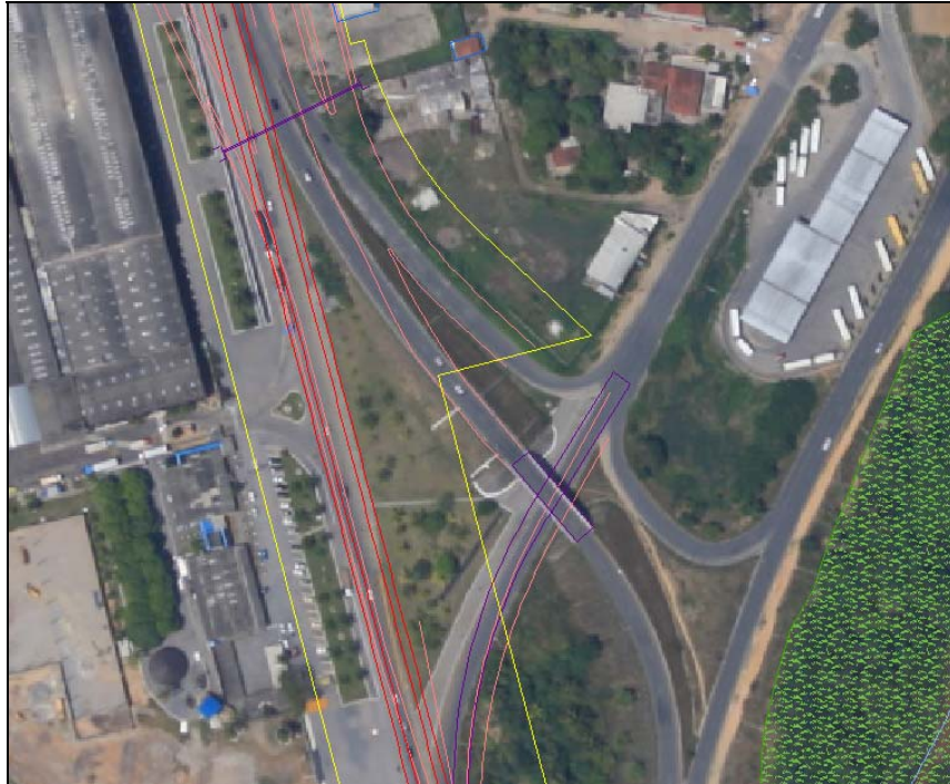
Figura 3. Trecho da BR-101 na escala 1:2500.

Como parte do Processamento Digital de Imagens – PDI as fotos foram convertidas do formato da câmera RAW, para o formato TIF, permitindo assim, a manipulação das mesmas em ambiente SIG. Após a conversão passaram por etapas de realce, conforme apresentado na Figura 4.