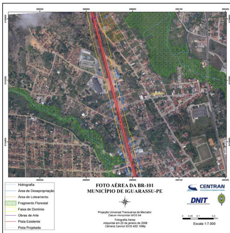
Figura 5. Carta imagem de parte da BR-101 no município de Igarassu/PE.

A metodologia avaliada permitiu identificar e monitorar (por meio de fotos anteriores) o cronograma de obras no trecho e espacializar processos correntes de desapropriação. A Figura 6 mostra um exemplo de desapropriação antes e após o início das obras e cobertura fotográfica da região. É possível identificar a remoção do imóvel visível na fotografia obtida com o sobrevôo no início de 2008.