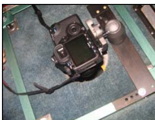
Figura 2: Câmera Cannon EOS 40DS acoplada à aeronave.

A câmera fotográfica utilizada neste trabalho é um equipamento disponível no mercado podendo ser classificada como uma “câmera não-métrica de pequeno formato”. Nesse caso, foi utilizado o equipamento Cannon EOS 40DS de 10 Mp, conforme Figura 2. O equipamento foi devidamente calibrado em gabinete visando à adequação de parâmetros necessários a etapa futura de correção geométrica do material. Tendo em vista a ausência de um Sistema Inercial de Coordenadas - SIC conectado a câmera, foi necessário aumentar a sobreposição das faixas de recobrimento do vôo o que resultou na ampliação do número de fotografias geradas.