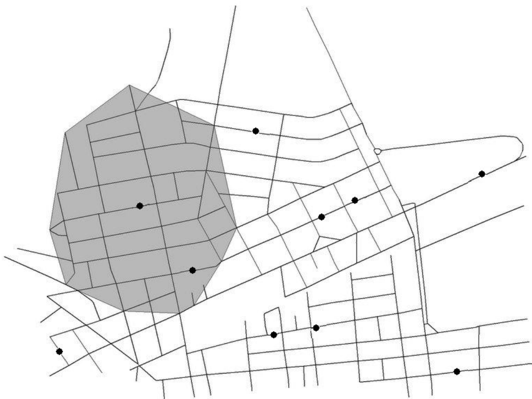
Figura 3: Polígono de Área de Serviço.