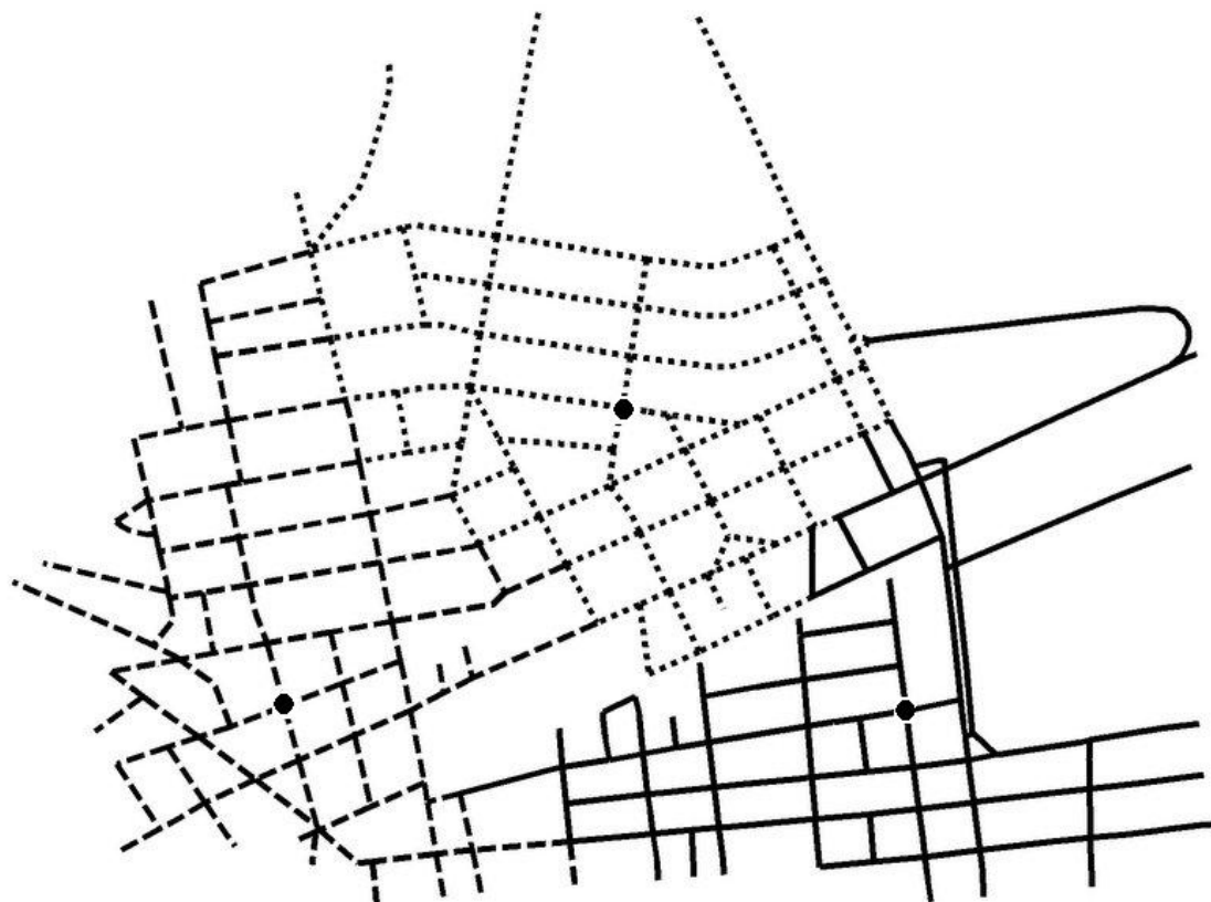
Figura 4: Três Agrupamentos de Ruas.

A Figura 4 mostra parcialmente uma tela do TerraView com três agrupamentos e seus respectivos centros em sua localização final.