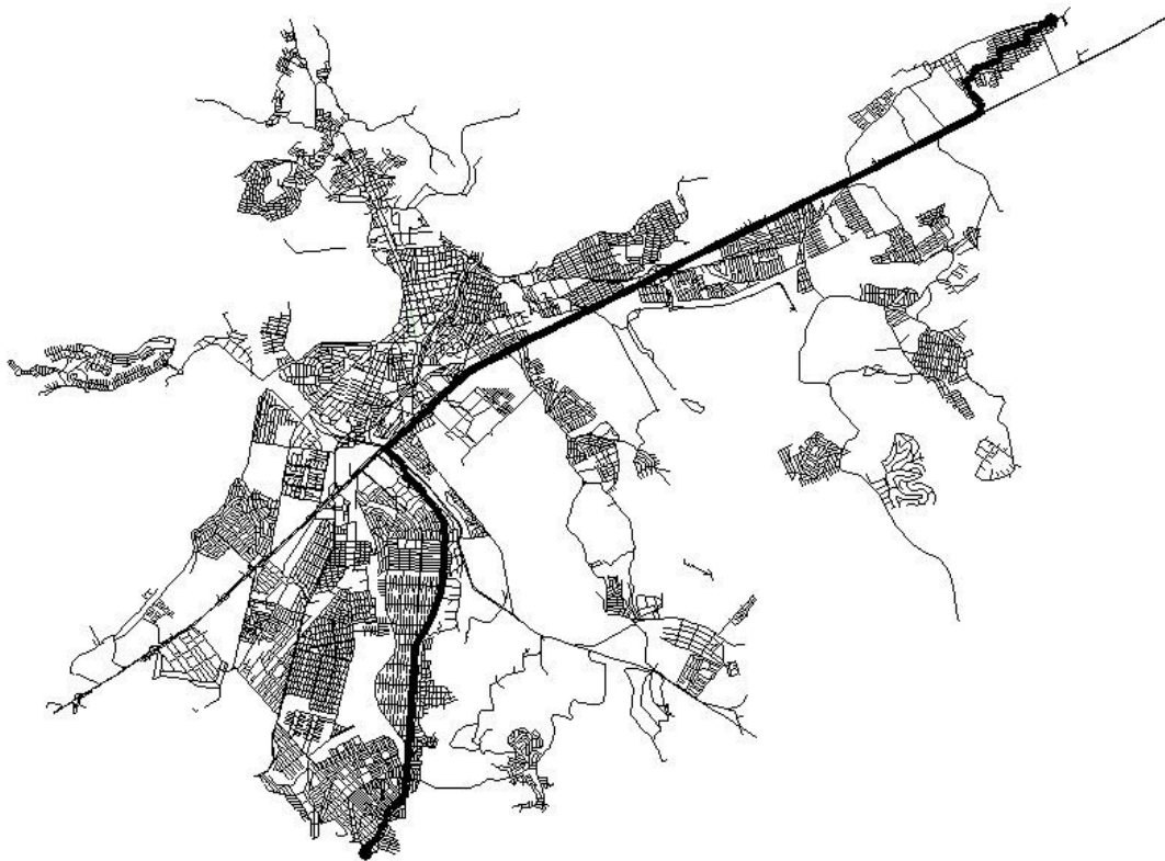
Figura 2: Caminho de Custo Mínimo.