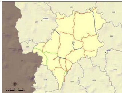
Figura 2. Mapa das rodovias da sub-bacia GD3 classificadas como obrigatórias, deslocamento e adicionais.

Contando com uma base digital de rodovias, foram selecionadas aleatoriamente 50% dessas, independentemente de serem rodovias federais ou estaduais, pavimentadas ou não. Nessas rodovias, agora denominadas obrigatórias, foram alocados os pontos amostrais. Uma vez que a demarcação dos pontos dependia da ocorrência das fisionomias ao longo das estradas, considera-se então que, esta também ocorreu de forma aleatória. Outras rodovias, que não as obrigatórias, também foram amostradas, sendo elas as de deslocamento e adicionais (Figura 2).