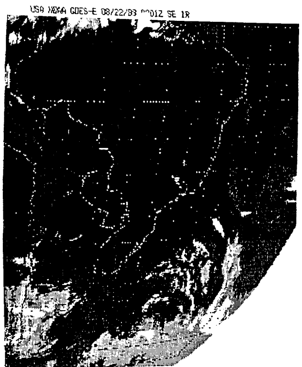
Fig. 3 - Imagem com quatro tonalidades, obtida em impressora.

satélite recebidas por linha telefônica. Em termos de custos, a EMBRATEL cobra uma assinatura mensal, os acessos à RENPAC como chamadas locais, e a quantidade de informação (Kbytes) transferida. O tempo de recepção de uma imagem de 32 Kbytes é da ordem de quatro minutos, e que será reduzido no futuro através de técnicas de compactação de arquivos.