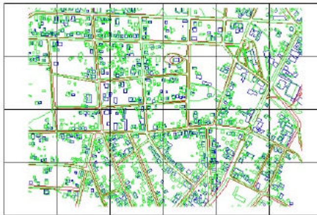
Figura 4: Sobreposição da restituição IKONOS e Aerototogramétrica.

A figura 4 mostra a sobreposição da restituição da imagem IKONOS com as feições em azul e vermelho e a restituição aerofotogramétrica com as feições cartográficas em verde.