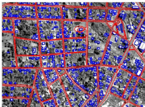
Figura 3- Digitalização das Feições Cartográficas sobre a Imagem IKONOS

O produto gerado pela restituição foi uma carta planimétrica de uma área pré-selecionada da cidade de Rio Negro-PR.