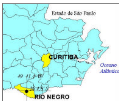
Figura 1: Situação do Município de Rio Negro no Estado do Paraná.

Foi também cedida, pelo órgão estadual citado a imagem IKONOS II, de resolução espacial de 1 metro, da mesma área (figura 2).